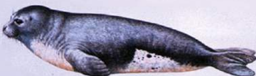
Cucciolo di un anno