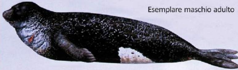
Esemplare maschio adulto