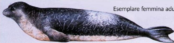
Esemplare femmina adulta